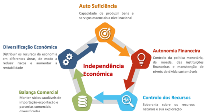
Figura 4: Abordagem Estratégica da Independência Económica

77. A actuação do Governo neste Pilar será na base dos programas a seguir: