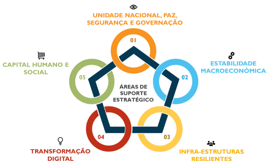
Figura 1: Áreas de Suporte Transversal